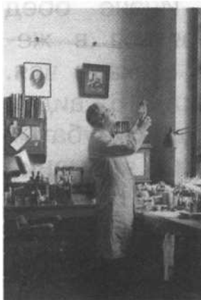
Микробиолог Александр Флеминг в своей лаборатории

Желанный помощник в каждой семье — печь СВЧ (знакомая нам микроволновка). Все хозяйки радостно встречают такой подарок: с этой печкой легко и быстро можно разморозить пищу, подогреть обед.