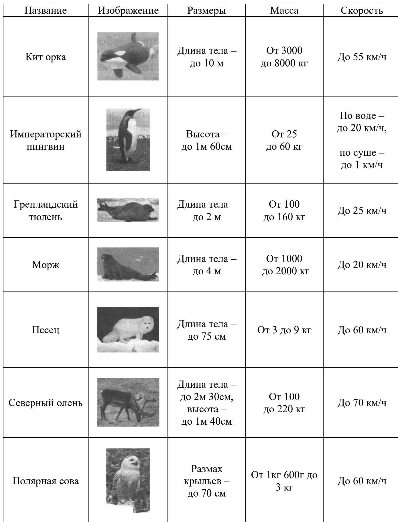
Таблица 1. Некоторые представители животного мира.