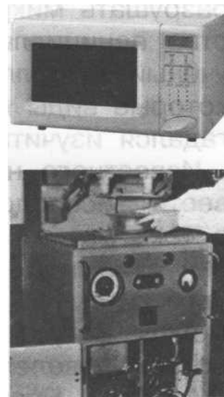
Современная микроволновая печь и первая микроволновая печь, выпущенная в США в 1949 году

Говорят, всё началось с того, что под воздействием микроволн расплавилась шоколадка в кармане Перси Спенсера, одного из инженеров американской компании. Микроволны нагревают предметы? Три года потребовалось Спенсеру для выяснения правильности своей гипотезы. И вот в 1945 году он получил разрешение на использование микроволн в приготовлении еды.